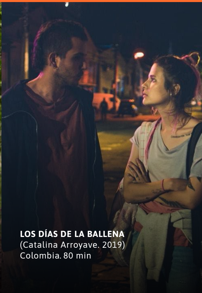
LOS DÍAS DE LA BALLENA (Catalina Arroyave, 2019) Colombia. 80 min