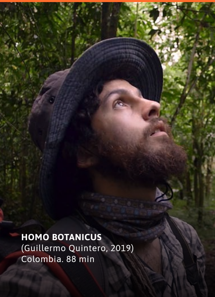
HOMO BOTANICUS (Guillermo Quintero, 2019) Colombia. 88 min