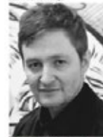
Aprender Original Cine, 1480'