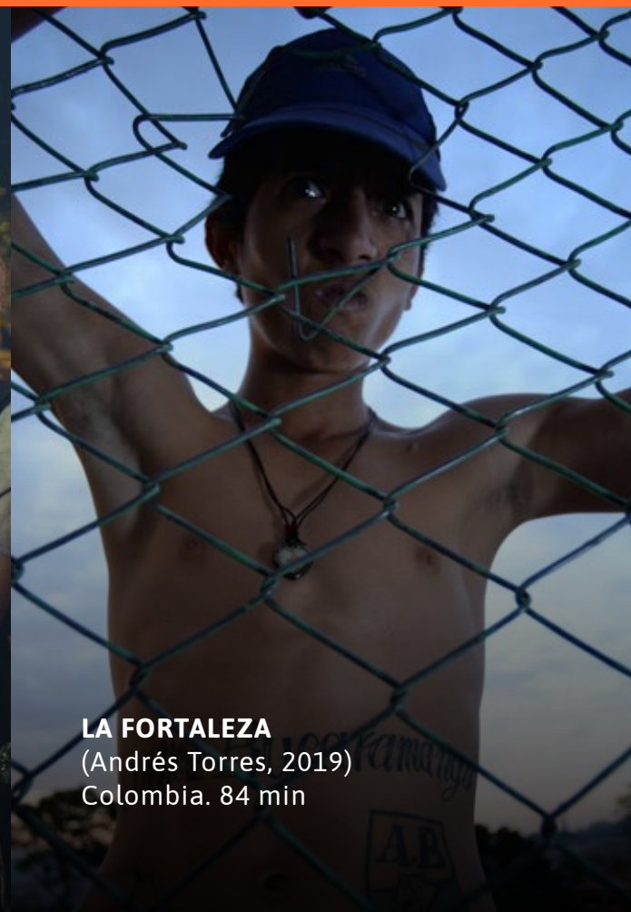
LA FORTALEZA (Andrés Torres, 2019) Colombia. 84 min

Valor por función: $ 5.000 COP - Horario para compra online: 8:00 a.m. a 10:00 p.m.