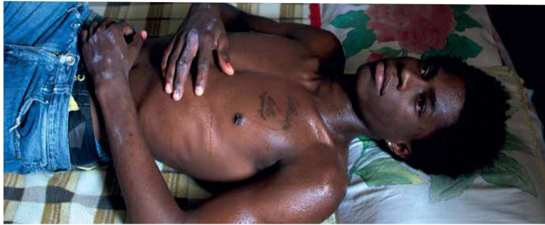
Los hongos (Dir. Oscar Ruiz Navia, 2014) Colombia. 103 min.