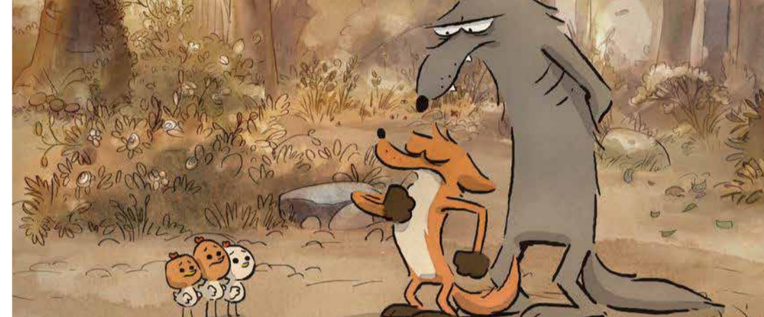
El gran zorro feroz (Dir. Benjamin Renner, Patrick Imbert, 2017) Francia. 80 min.