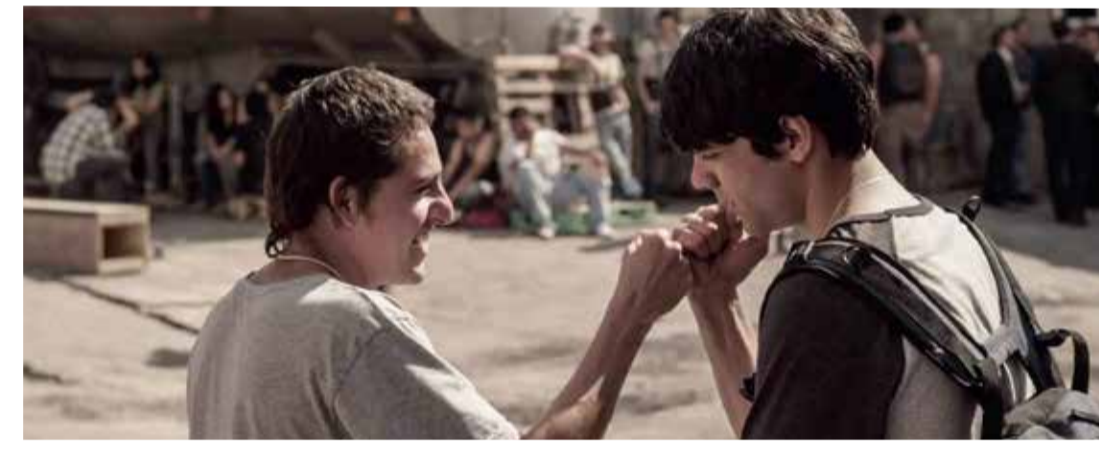
Te prometo anarquía (Dir. Julio Hernández Córdón, 2015) México, Alemania. 88 min.