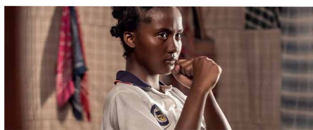
La suprema (Dir. Felipe Holguin, 2023) Colombia. 83 min.