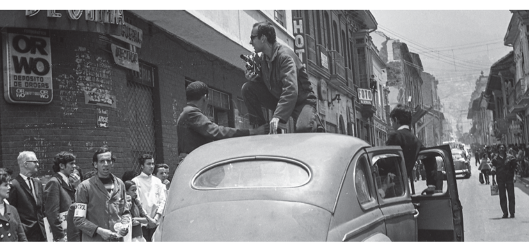
El film justifica los medios (Dir. Jacobo del Castillo, 2021) Colombia. 78 min.

Para mayores de 12 años Diálogo con el público 3:00 p.m.