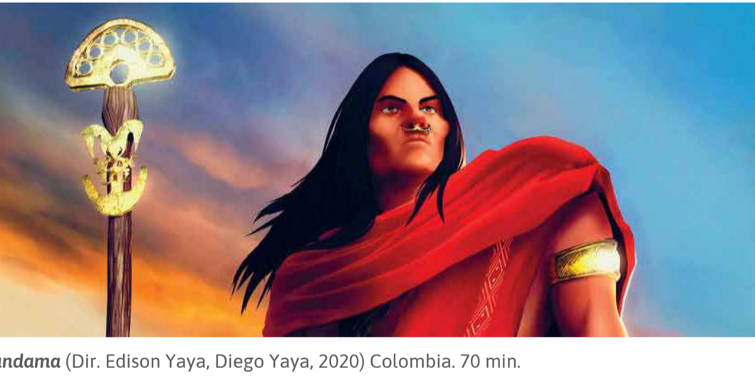
Tundama (Dir. Edison Yaya, Diego Yaya, 2020) Colombia. 70 min.