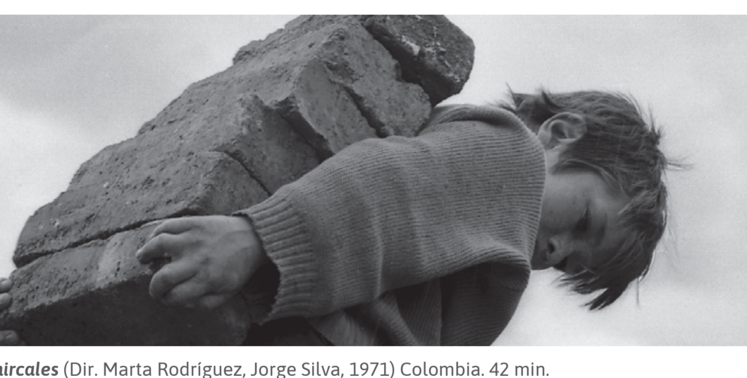
Chircales (Dir. Marta Rodríguez, Jorge Silva, 1971) Colombia. 42 min.

4:00 p.m. En alianza con el Festival Planet On