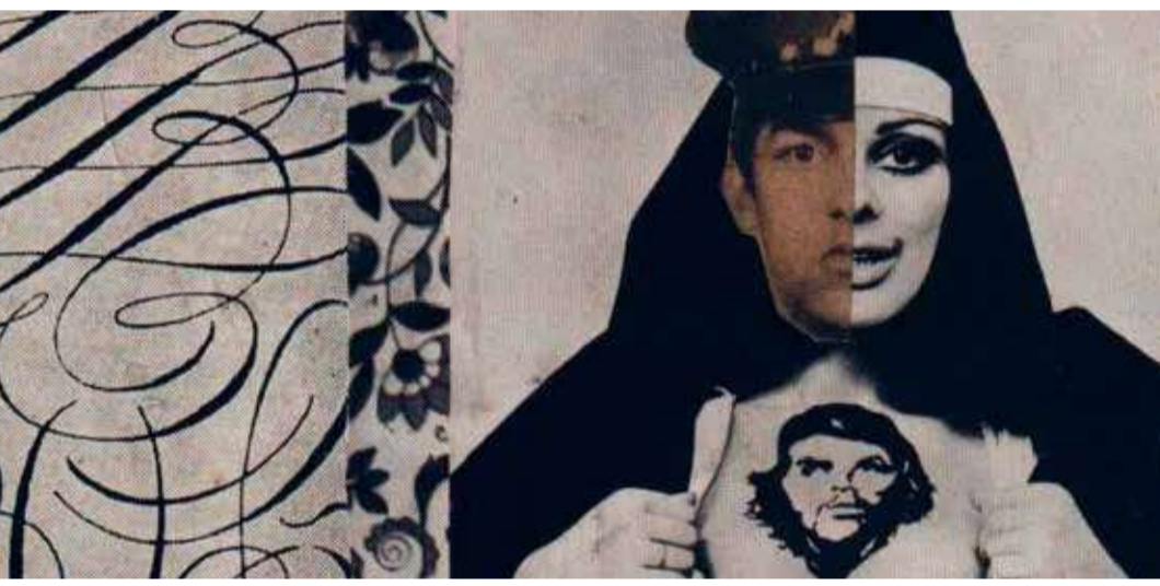
El ojo del turista (Dir. Luis Ospina, 2021) Colombia. 40 min.