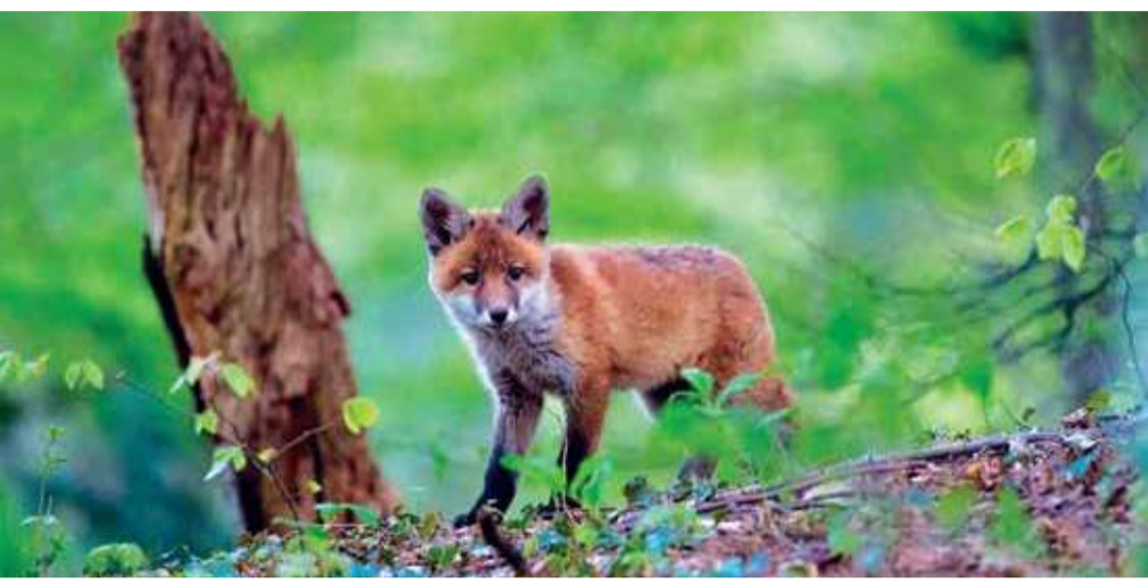
Vecinos inesperados (Dir. Mauricio Vélez Domínguez, 2019) Colombia. 79 min.