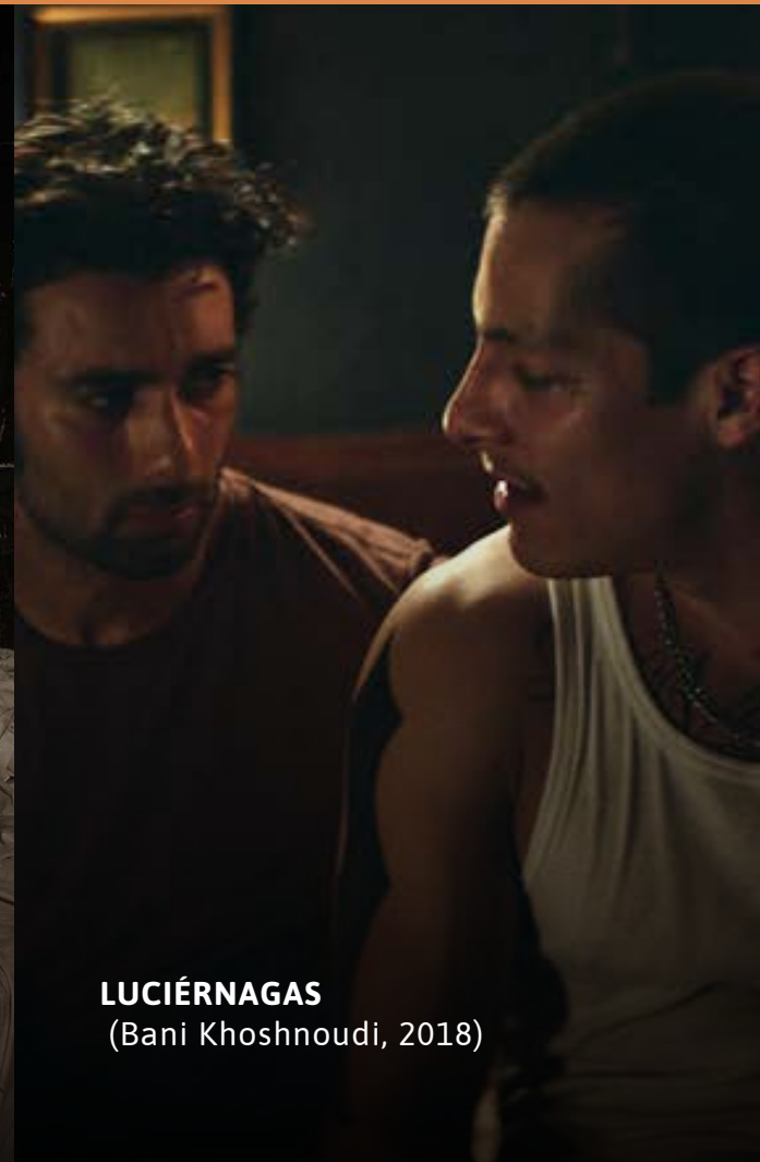
LUCIÉRNAGAS (Bani Khoshnoudi, 2018)

Valor por función: $ 5.000 COP - Horario para compra online: 8:00 a.m. a 10:00 p.m.