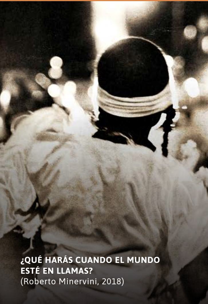
¿QUÉ HARÁS CUANDO EL MUNDO ESTÉ EN LLAMAS? (Roberto Minervini, 2018)