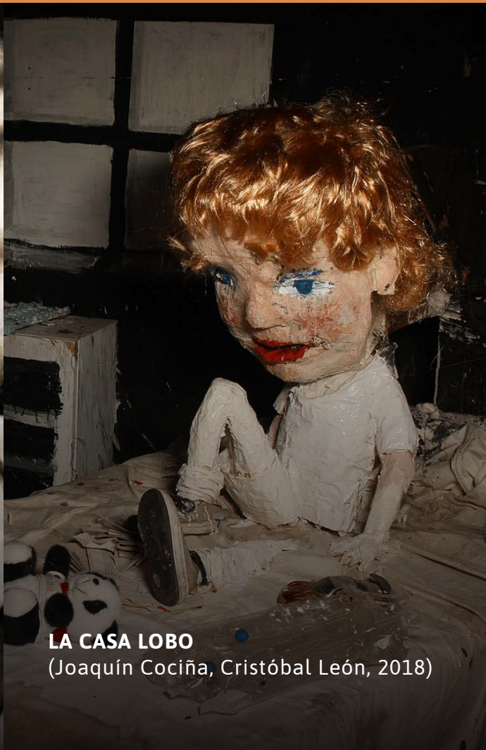
LA CASA LOBO (Joaquín Cociña, Cristóbal León, 2018)