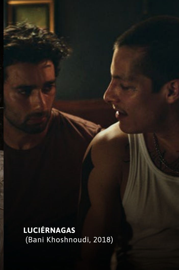
LUCIÉRNAGAS (Bani Khoshnoudi, 2018)

Valor por función: $ 5.000 COP - Horario para compra online: 8:00 a.m. a 10:00 p.m.