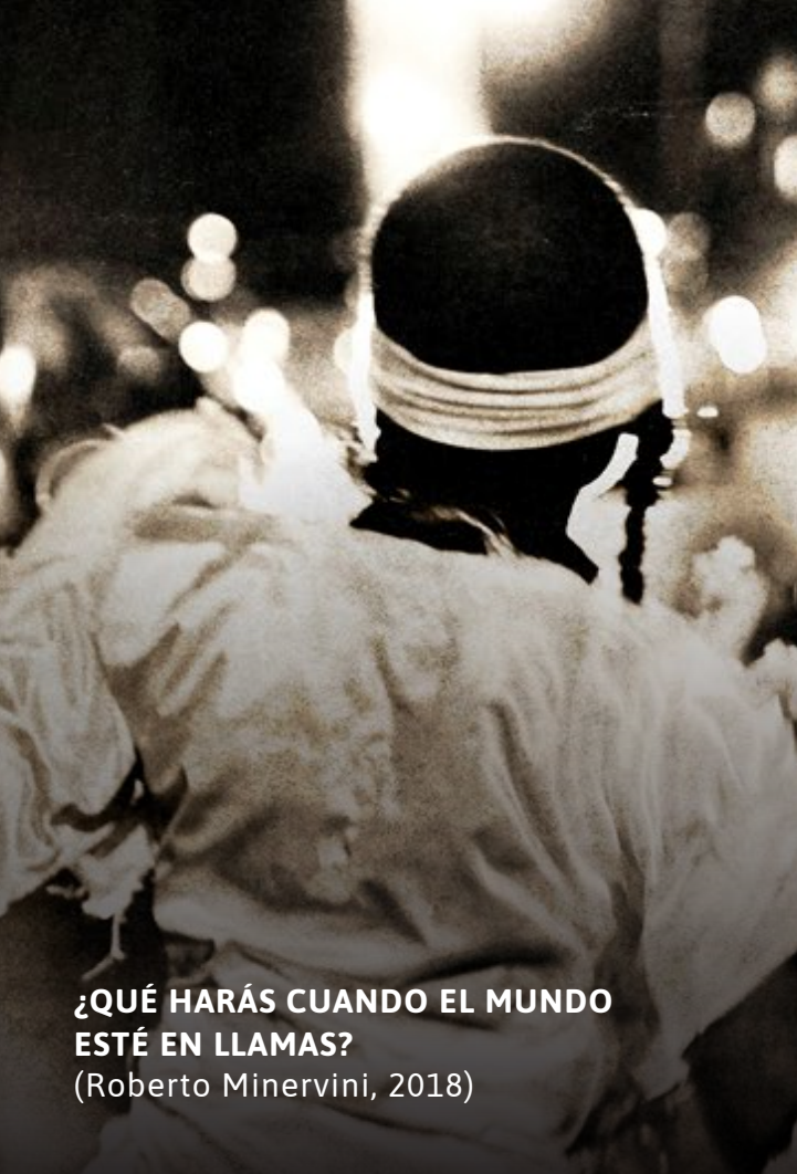
¿QUÉ HARÁS CUANDO EL MUNDO ESTÉ EN LLAMAS? (Roberto Minervini, 2018)