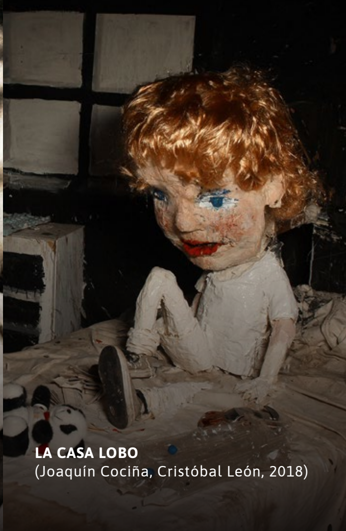
LA CASA LOBO (Joaquín Cociña, Cristóbal León, 2018)