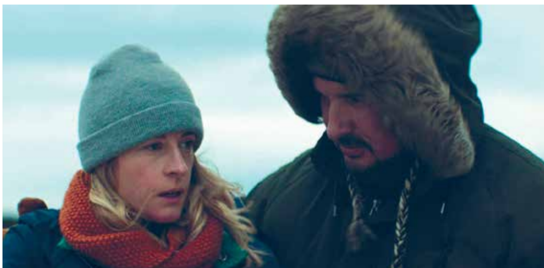
Nuevo Quebec (Dir. Sarah Fortin, 2021) Canadá. 96 min.