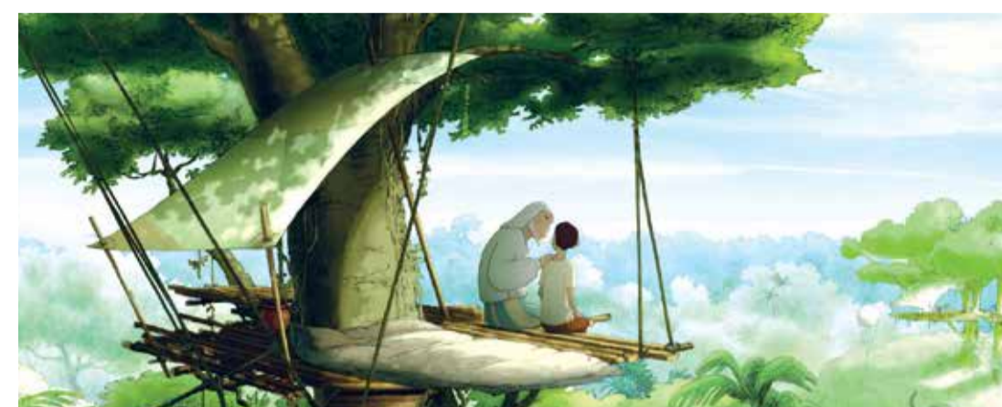
El viaje del príncipe (Dir. Jean-François Laguionie, 2019) Francia. 76 min.

En alianza con el Instituto Francés y la Embajada de Francia en Colombia 2:00 p.m.