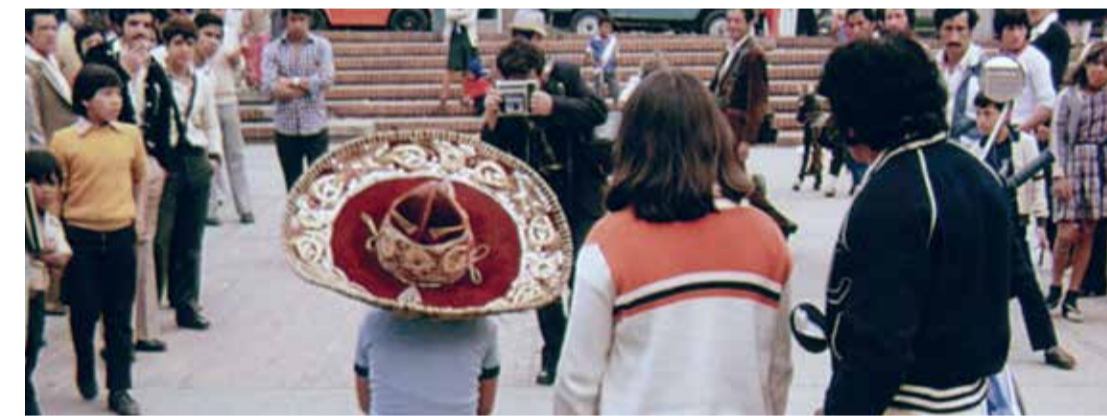
Cine revista (Dir. Heriberto Fiorillo, 1980) Colombia. 40 min.