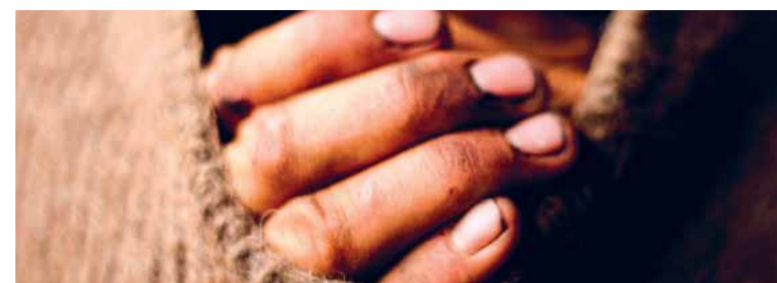
Sumercé (Dir. Victoria Solano, 2020) Colombia. 83 min.

Sumercé (Dir. Victoria Solano, 2020) Colombia. 83 min. Para mayores de 7 años 4:00 p.m.