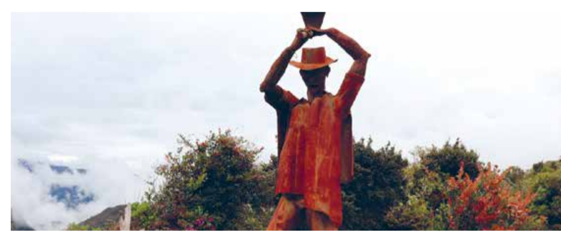
Sumapaz, en el corazón del conflicto (Dir. Marcelo Molano, 2022) Colombia. 116 min.

Memorias Cinemateca Rodante: mujeres creadoras Al sonar campesino (Dir. Sonia Cifuentes, 2015). Bogotá. 15 min. Suyai (Dir. Martha Alejandra Villalba, 2015). Bogotá. 14 min. Elena Corazón de Tierra (Dir. Daniela Castañeda Meneses, 2019) Localidad de Santa Fé. 3 min. Con Cierto Amor (Dir. Paula Fernanda Sánchez Sánchez, 2019) Localidades de Bosa, Engativá, Usme, Santafé. 13 min. Mujeres semillas de vida (Dir. Creación Colectiva, 2016) Localidad de La Candelaria. 11 min. 3:00 p.m.