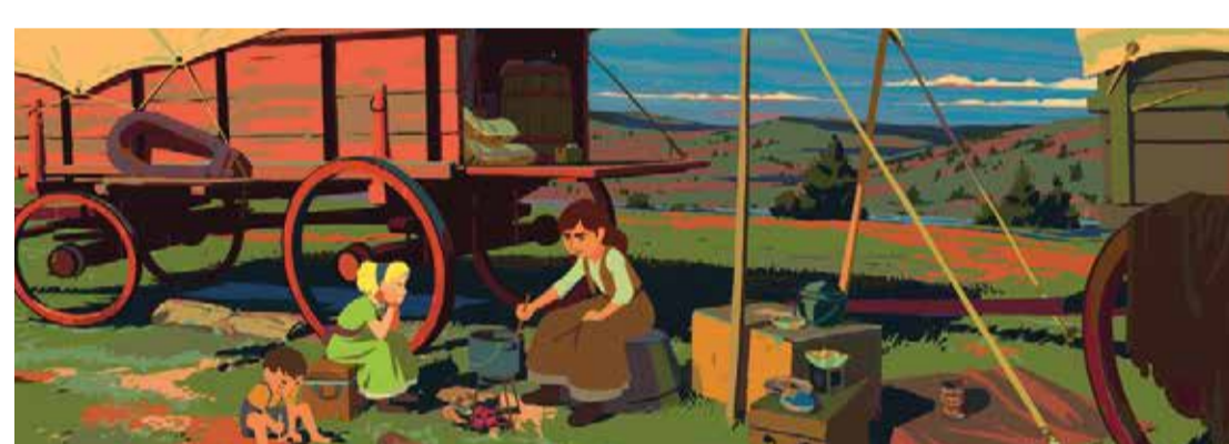
Calamity (Dir. Rémi Chayé, 2020) Francia. 89 min

Calamity (Dir. Rémi Chayé, 2020) Francia. 89 min Alianza con la Embajada de Francia en Colombia 2:00 p.m.