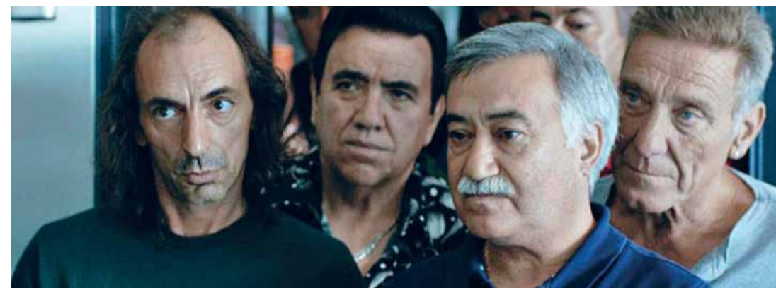
Provas, exorcismos (Dir. Susana Nobre, 2015) Portugal. 25 min.

Eclécticas Rotos (Dir. Yrilen Jéssica Gómez Pinilla, 2020) Localidad de Engativá. 11 min. Marina (Dir. María Margarita Jiménez Moyano, 2019) Localidades de Usaquén, Chapinero, Santa Fe, Teusaquillo. 10 min. Bárbara (Dir. Tomasa Congote Schönwald, 2020) Localidad de Chapinero. 9 min. Zapatillas (Dir. Mónica Juanita Hernández, 2019) Localidades de Usaquén, Chapinero, Teusaquillo, Candelaria. 16 min. Para mayores de 12 años 3:00 p.m.