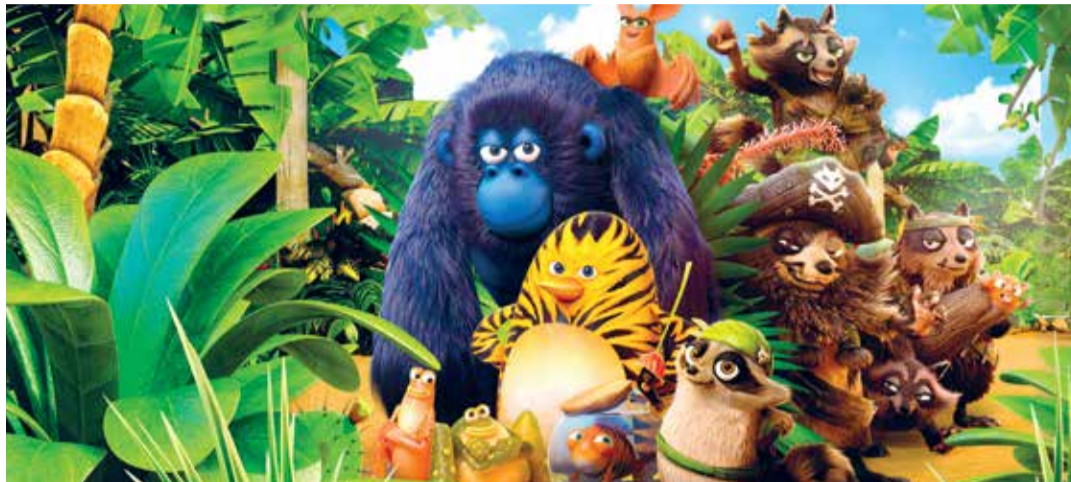
La jungla de la locura (Dir. David Alaux, 2017) Francia. 97 min.

La jungla de la locura (Dir. David Alaux, 2017) Francia. 97 min. 2:00 p.m.