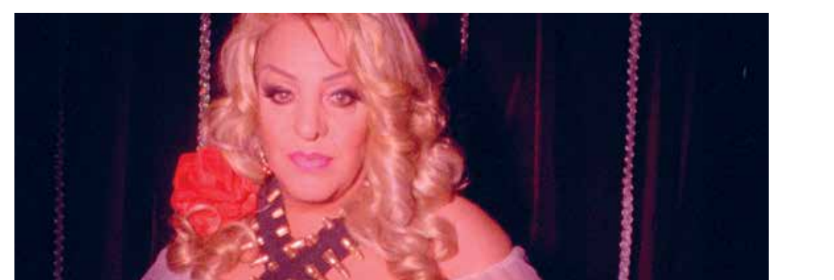
Casa Rosell (Dir. Camila José Donoso, 2017) México. 71 min.

Directoras latinoamericanas Casa Rosell (Dir. Camila José Donoso, 2017) México. 71 min. 5:00 p.m. Para mayores de 12 años