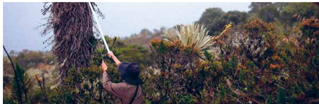
Homo Botanicus (Dir. Guillermo Quintero, 2019) Colombia. 88 min.

Biodiversidad en Colombia Homo Botanicus (Dir. Guillermo Quintero, 2019) Colombia. 88 min. Diálogo con el público 3:00 p.m.