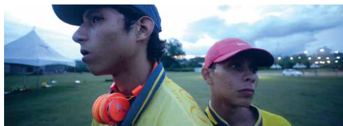
La fortaleza (Dir. Andrés Torres, 2020) Colombia. 84 min.

La fortaleza (Dir. Andrés Torres, 2020) Colombia. 84 min. Para mayores de 15 años 5:00 p.m.