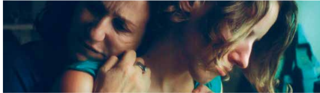
Familia sumergida (Dir. María Alché, 2018) Argentina, Brasil. 91 min.

Directoras latinoamericanas Familia sumergida (Dir. María Alché, 2018) Argentina, Brasil. 91 min. 5:00 p.m.