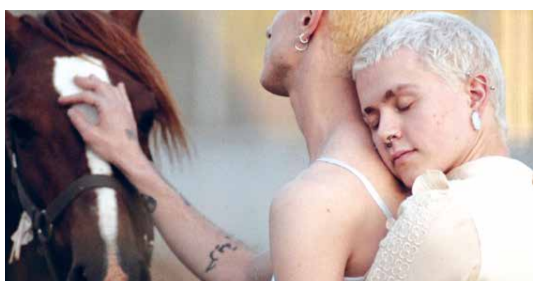
Amor Fati (Dir. Cláudia Varejão, 2020) Portugal. 101 min.

Semana del cine portugués Amor Fati (Dir. Cláudia Varejão, 2020) Portugal. 101 min. Para mayores de 12 años 5:00 p.m.