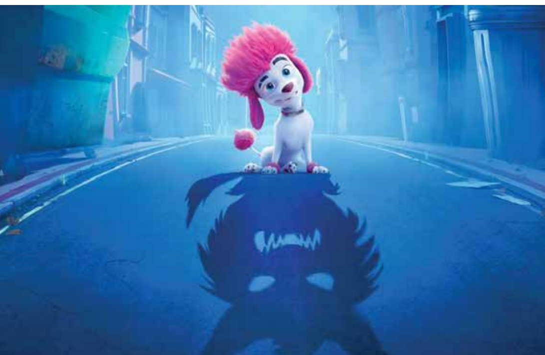
100% lobo (Dir. Alexs Stadermann, 2020) Australia. 96 min.

Del otro lado (Dir. Iván Guarnizo, 2021) Colombia, España. 83 min.