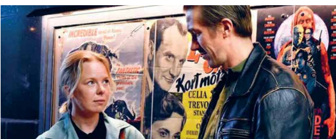
Hojas de Otoño (Dir. Aki Kaurismäki, 2023) Finlandia, Alemania. 81 min