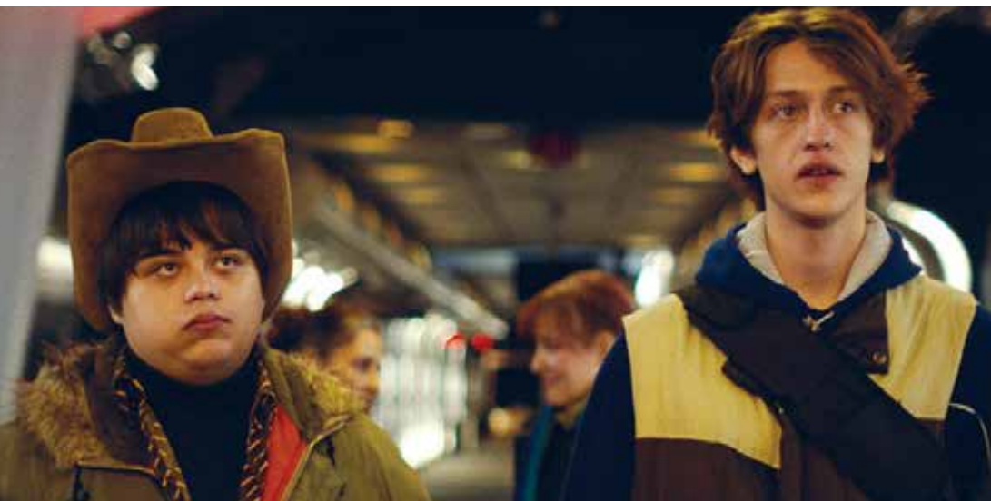
I Like Movies (Dir. Chandler Levack, 2022) Canadá. 99 min.