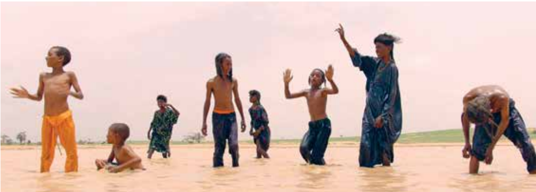
Marcher sur l'eau (Dir. Aïssa Maïga, 2022) Francia, Bélgica. 90 min.