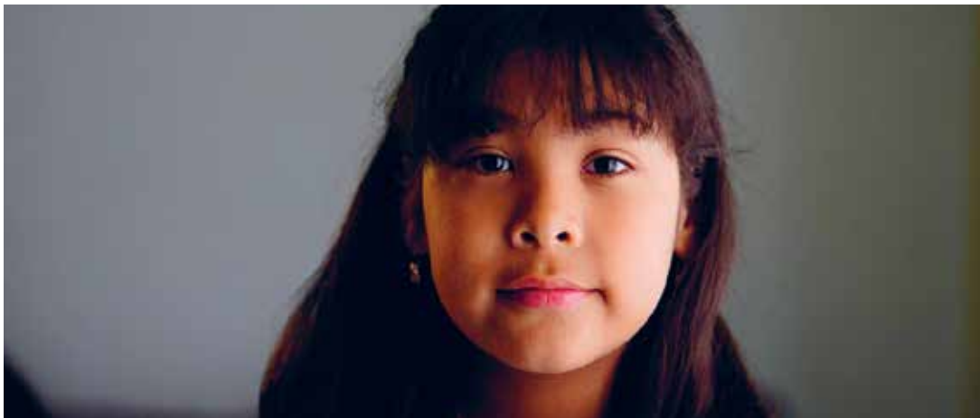
Si Dios Fuera Mujer (Dir. Angélica Cervera Aguirre, 2021) Colombia. 71 min.

La traversée (Dir. Florence Mialthe, 2021) Francia, Alemania, República Checa. 84 min.