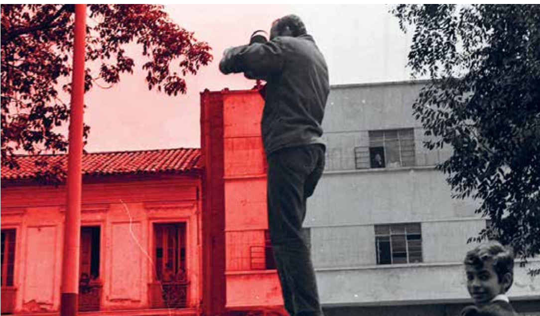
El film justifica los medios (Dir. Juan Jacobo del Castillo, 2021) Colombia. 76 min.

Les quatre cents coups (Dir. François Truffaut, 1959) Francia. 94 min.