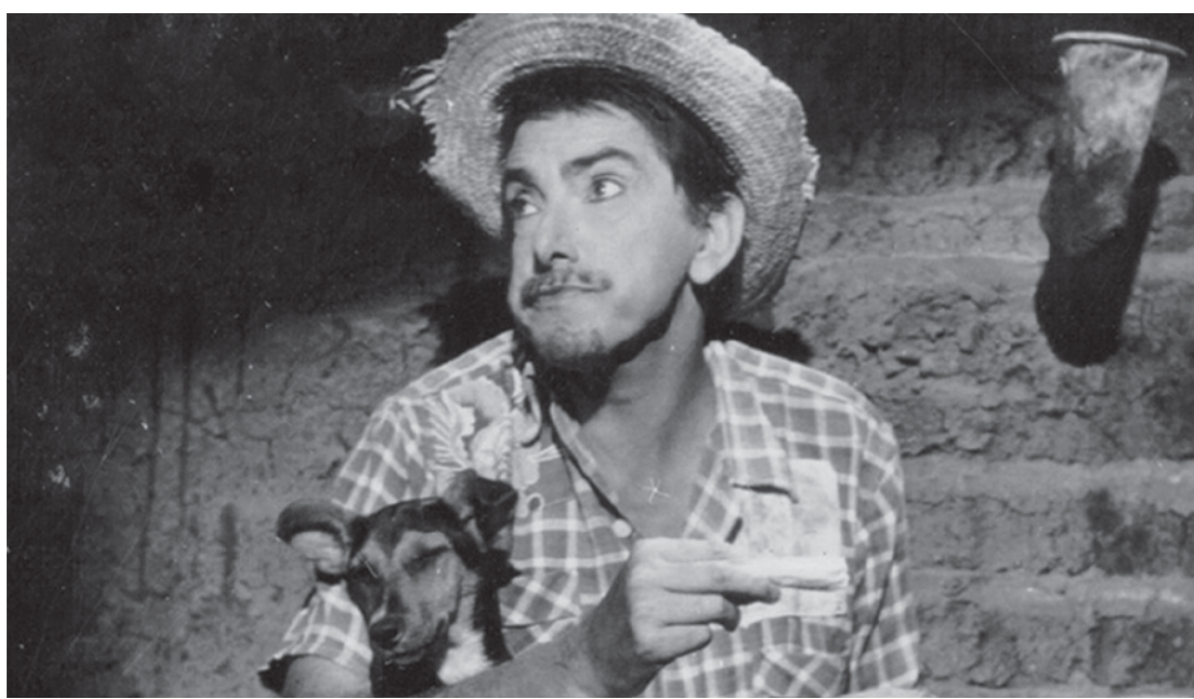
Jeca Tatu (Dir. Milton Amaral, 1959)