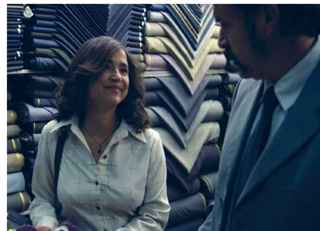
Salvador (Dir. César Heredia, 2022) Colombia. 87 min.

Tángaras en el aire: una danza sin fronteras (Dir. Laura Catalina Peña Hernández, 2024) Colombia. 12 min. Para todo público Diálogo con el público 2:00 p.m.