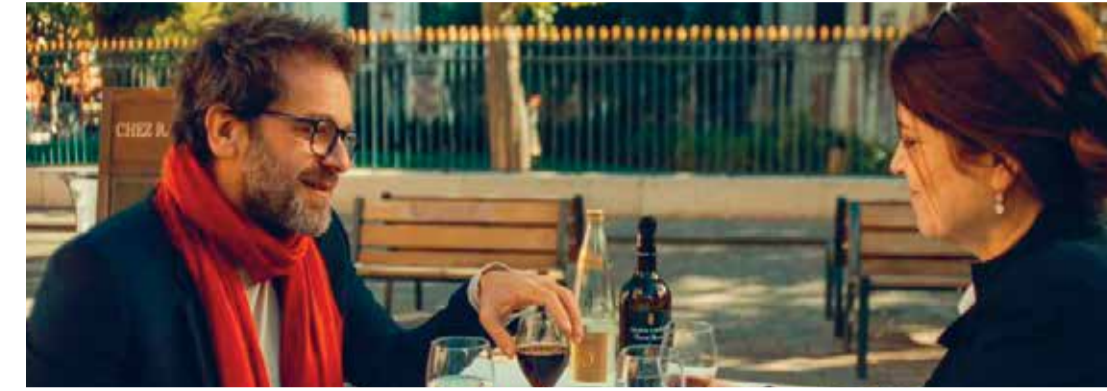
El curso de la vida (Dir. Frédéric Sojcher, 2022) Francia. 90 min.

El curso de la vida (Dir. Frédéric Sojcher, 2022) Francia. 90 min. Para todo público Idioma original - Subtítulos en español En alianza con la Embajada de Francia en Colombia 2:00 p.m.