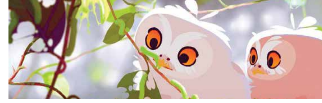
La odisea de Choum (Dir. Julien Bisaro, 2019) Francia. 26 min.

Programa de cortos Mi amigo el Mundo La odisea de Choum (Dir. Julien Bisaro, 2019) Francia. 26 min. Mamá es pura lluvia (Dir. Hugo de Faucompret, 2021) Francia. 27 min. Para todo público Idioma original - Subtítulos en español En alianza con la Embajada de Francia en Colombia 2:00 p.m.