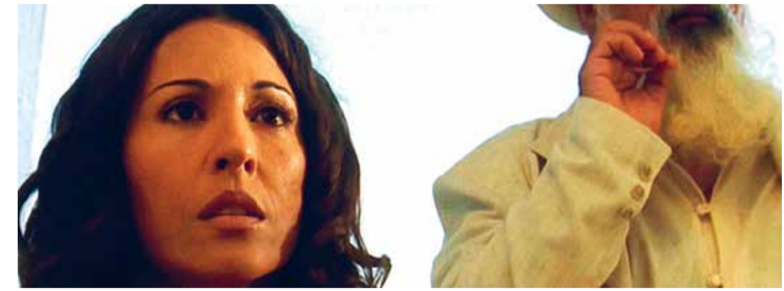
Bolívar soy yo (Dir. Jorge Ali Triana, 2002) Colombia. 93 min.

Bolívar soy yo (Dir. Jorge Ali Triana, 2002) Colombia. 93 min. Para mayores de 16 años En alianza con Fundación Patrimonio Fílmico Colombiano 4:00 p.m.