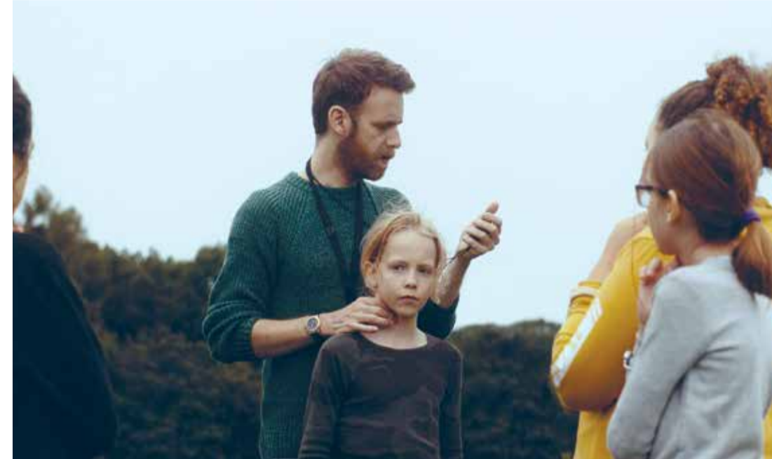
Marinette (Dir. Virginie Verrier, 2022) Francia. 96 min.

Pequeña naturaleza (Dir. Samuel Theis, 2021) Francia. 93 min. Para mayores de 12 años Idioma original - Subtítulos en español En alianza con la Embajada de Francia en Colombia 4:00 p.m.