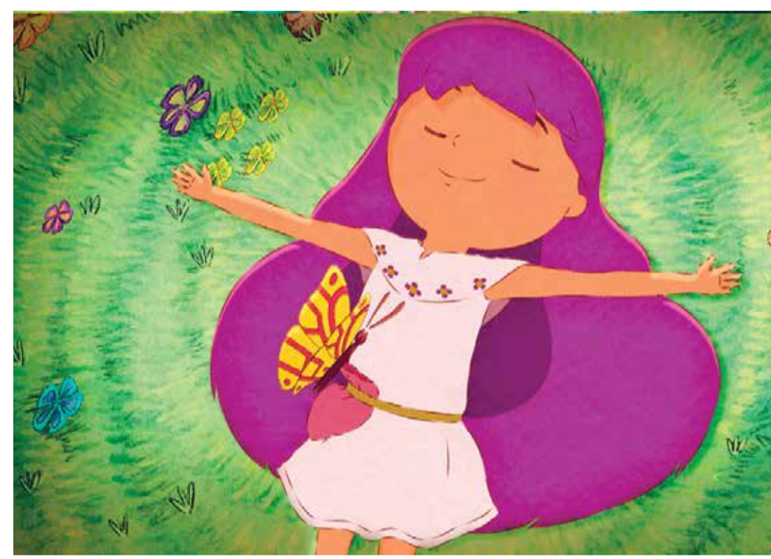
Antonia en la vida (Dir. Natalia Rojas Gamarra, 2022) Perú. 72 min.

Antonia en la vida (Dir. Natalia Rojas Gamarra, 2022) Perú. 72 min. Para mayores de 12 años En alianza con la Embajada de Perú