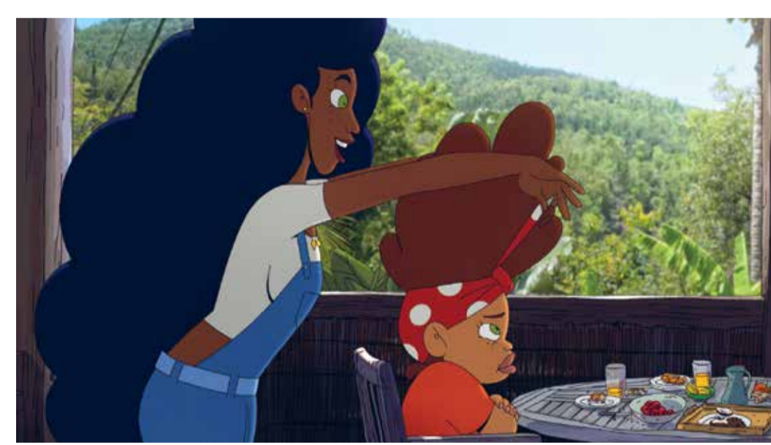
Vainilla (Dir. Guillaume Lorin, 2020) Francia. 32 min.

Vainilla (Dir. Guillaume Lorin, 2020) Francia. 32 min. Para todo público Idioma original - Subtítulos en español En alianza con la Embajada de Francia en Colombia Diálogo con el público 2:00 p.m.