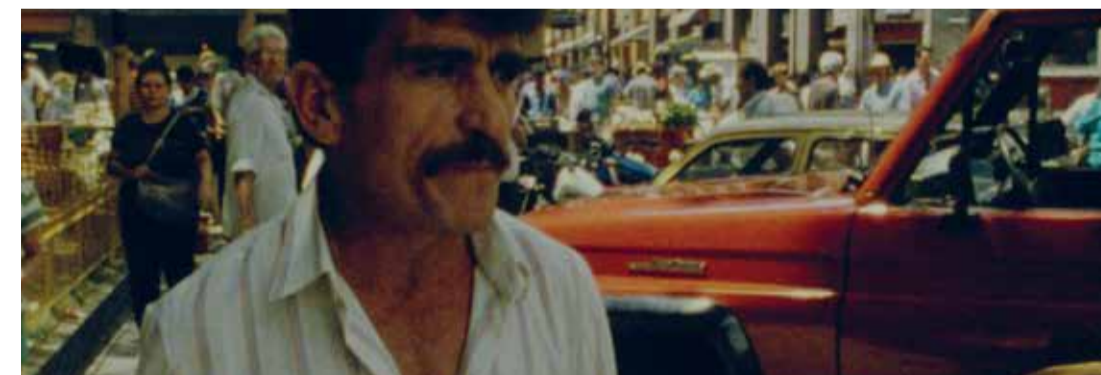
Róbal con arepa (Dir. Gustavo Fernández, 1991) Colombia. 28 min.

Róbal y El diablo, cortos de Gustavo Fernández El diablo y la rumba (Dir. Gustavo Fernández, 1990) Colombia. 35 min. Róbal con arepa (Dir. Gustavo Fernández, 1991) Colombia. 28 min. Para todo público Diálogo con el público Cinemateca de Bogotá Fontanar del Río 4:00 p.m.