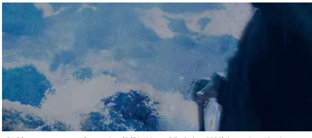
¿Qué hago en este mundo tan visual? (Dir. Manuel Embalse, 2020) Argentina. 63 min.