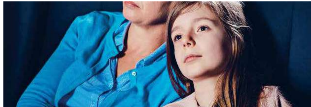
Una niña (Dir. Sébastien Lifshitz, 2020) Francia. 85 min.