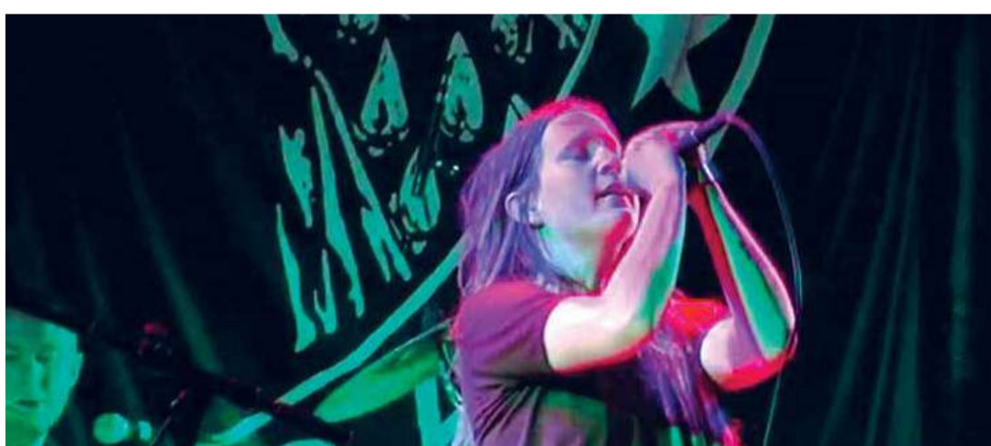
Ruido y resistencia (Dir. Julia Ostertag y Francesca Araiza Andrade, 2011) Alemania. 89 min.