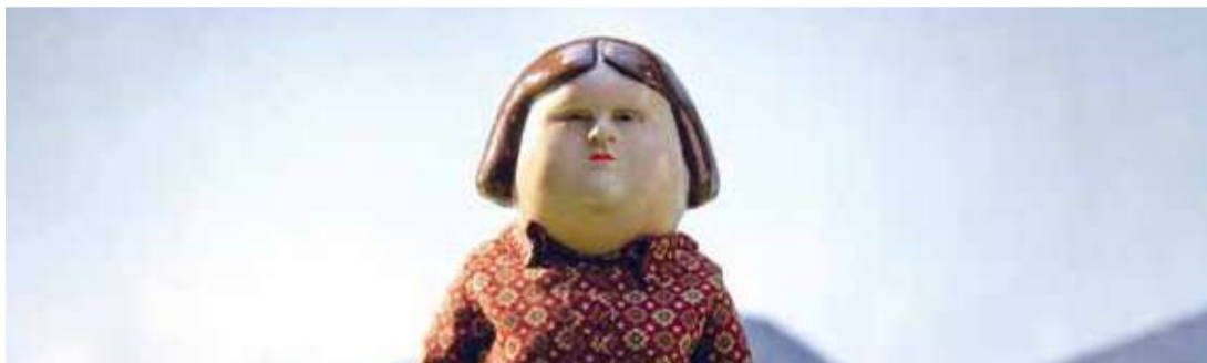
Bestia (Dir. Hugo Covarrubias, 2021) Chile. 15 min.

5:00 p.m. Para mayores de 12 años En alianza con el Festival Internacional de la Imagen