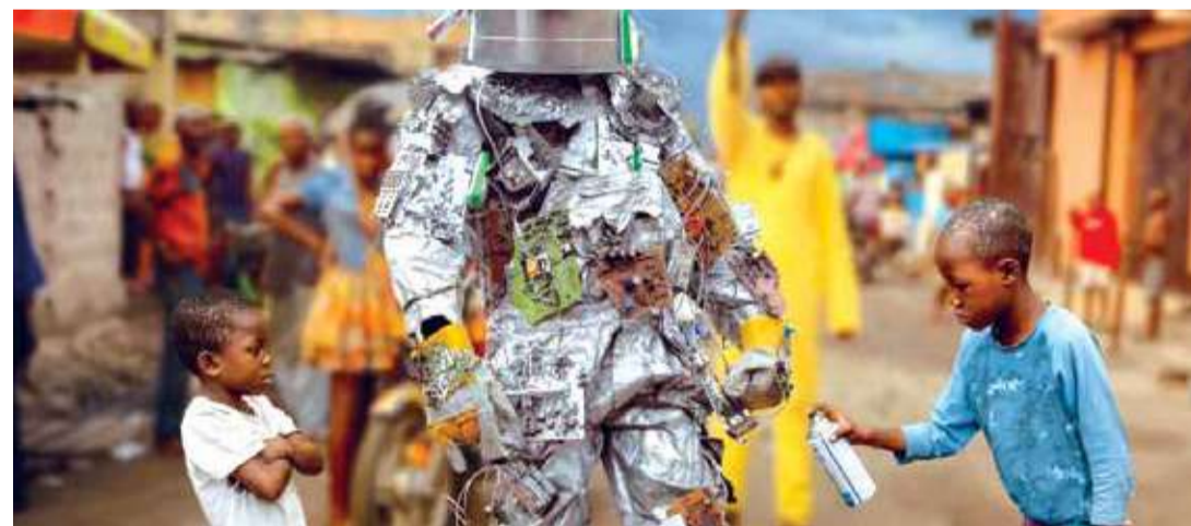
Sistema K (Dir. Renaud Barret, 2019) Francia. 94 min.