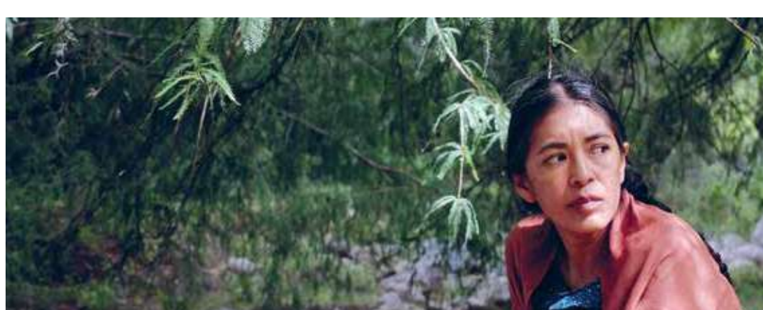
Tiempo de lluvia (Dir. Itandehui Jansen, 2019) México. 89 min.