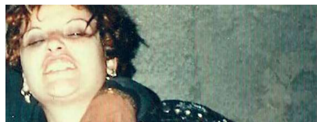
Vivir para luchar (Dir. Marina Knup, 2010) Brasil. 86 min.

5:00 p.m. Para mayores de 12 años En alianza con la Feria de Cine Independiente de Bogotá - FECI