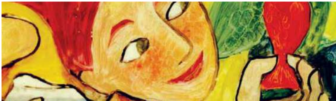
El jardín (Dir. Marie Paccou, 2003) Francia. 7 min.