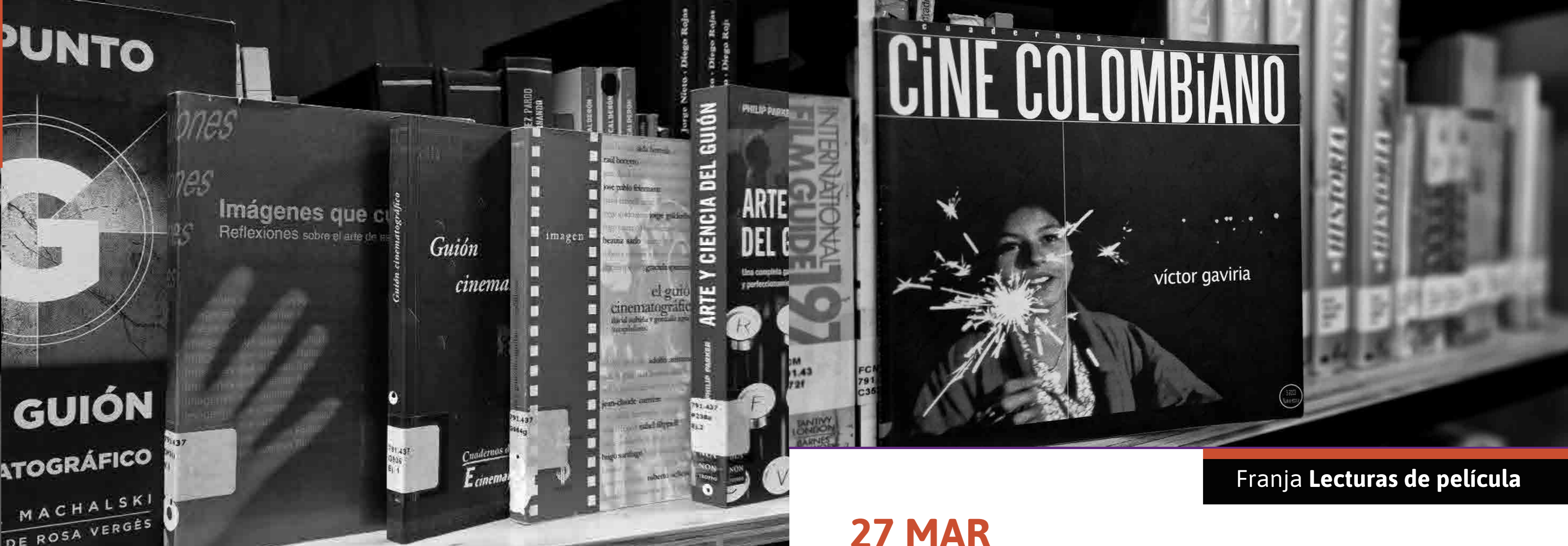
Franja Exploración y creación

► Inscripciones del 1 al 7 de marzo https://forms.gle/xcJWADumqXQpC9Su5 *Actividad recomendada para mayores de 15 años