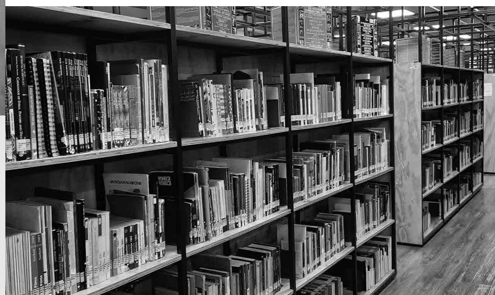
Franja Rutas de lectura