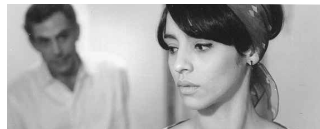
Memorias del subdesarrollo (Dir. Tomás Gutiérrez Alea, 1968) Cuba. 104 min.