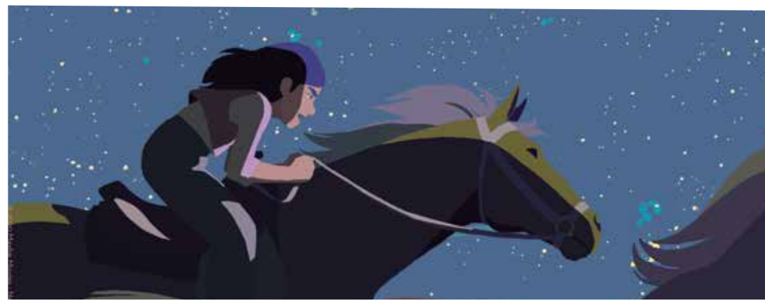
Calamidad (Rémi Chayé, 2020) Francia, Dinamarca. 82 min.