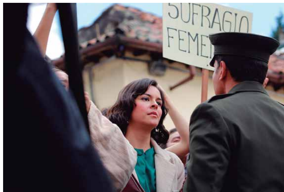
Estimados Señores (Dir. Patricia Castañeda, 2024) Colombia. 98 min.

CEFE Fontanar del Río. Avenida Calle 145 No.138A-10 / Localidad de Suba