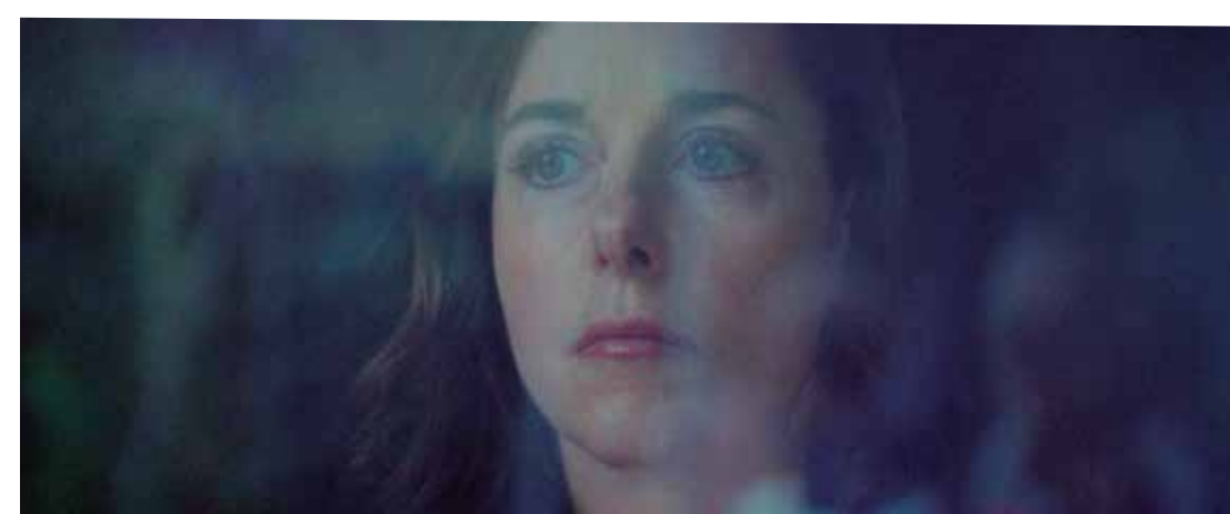
A Tiempo Completo (Dir. Eric Gravel, 2022) Francia. 100 min.