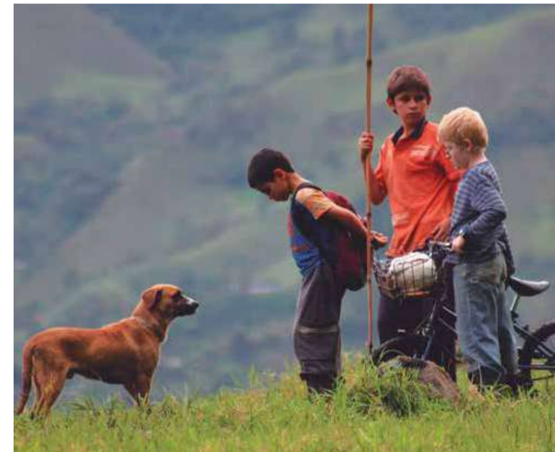
Los Colores de la Montaña (Dir. Carlos César Arbeláez, 2011) Colombia. 94 min.