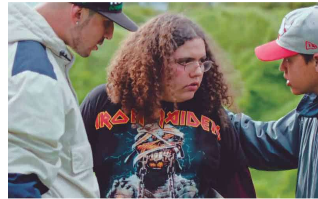
La noche de la bestia (Mauricio Leyva Cock, 2021) Colombia. 73 min.