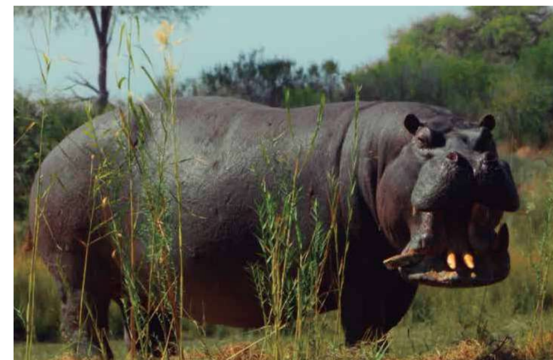
Pepe (Dir. Nelson Carlos de los Santos Arias, 2024) República Dominicana, Francia, Alemania, Namibia. 122 min.