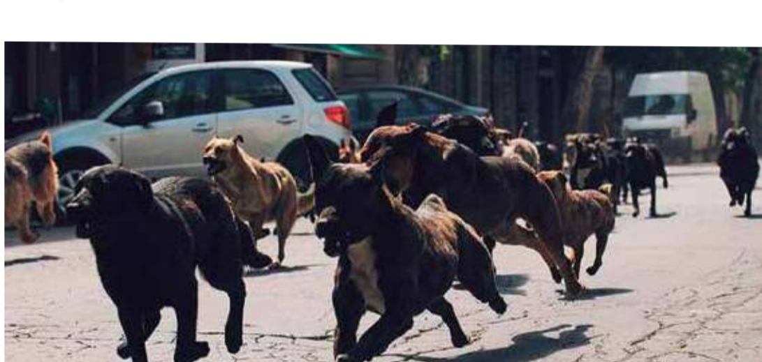
Buscando a Hagen (Dir. Kornél Mundruczó, 2019) Hungría, Alemania, Suecia. 119 min.