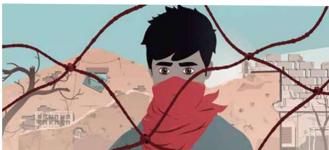
La Sirena (Dir. Sepideh Farsi, 2022) Francia, Alemania, Luxemburgo, Bélgica. 101 min.