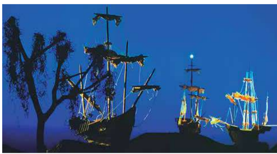
Cristóbal Colón (Dir. Fernando Laverde, 1983) Colombia. 63 min.