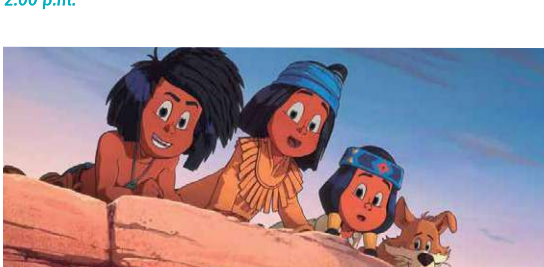
Yakari, le film (Dir. Xavier Giacometti, Toby Genkel, 2019) Francia. 82 min.