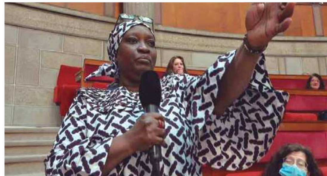
Levántate mujeres (Dir. Gilles Perret, François Ruffin, 2021) Francia. 85 min.